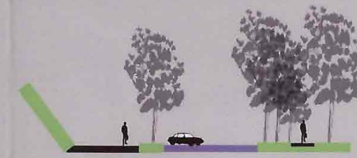
PROFIL PROPUS - CIRCULATIE MEDIANA SECTIUNE S-S