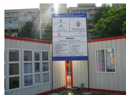
Biroul Relații cu Publicul Organizarea de șantier Centrul Istoric București

Vă invităm să ne vizitați la biroul de Relații cu Publicul , pe strada Șepcari (în spatele Hanului Manuc ), pentru informații despre desfășurarea proiectului din Zona Pilot A, a Centrului Istoric București.