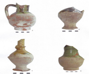
Ceramică din secolul XIX Strada Sfântul Dumitru

3. Urma traseului actualei străzi Pictor Nicolae Tonitza până în Strada Franceză. În dreptul Casei de Credit PTT, Strada Sfântul Dumitru era mai îngustă decât în prezent.