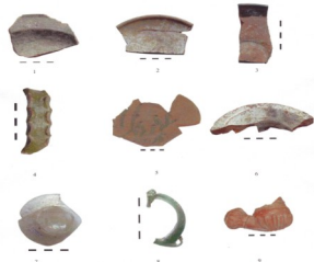
Descoperiri din secolul XIX Ceramică și sticlă Strada Sfântul Dumitru

Descriere: - pereți arcuiți, buză evazată și răsfrântă în formă de guler, cu marginea subțiată și șanțuire spre interior, toartă cu bandă lată de 3,1 cm, cu ataș superior sub marginea buzei și ataș inferior în zona diametrului maxim.