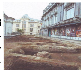
Strada Sfântul Dumitru

Compania SEDESA și Primăria Municipiului București, în vederea unei bune informări asupra desfășurării Proiectului de “Reabilitare al străzilor și rețelelor din cadrul Zonei Pilot A, a Centrului Istoric al Municipiului București”, vă pun la dispoziție buletinul lunar informativ.